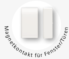
Magnetkontakt für Fenster/Türen