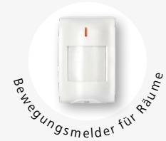
Bewegungsmelder für Räume